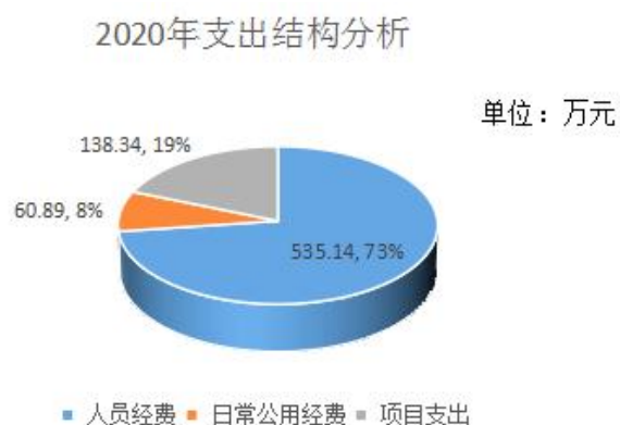
图 2：支出决算构成情况（按支出性质）