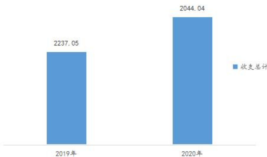
图 1：2019-2020 年收支总计对比情况

本部门 2020 年度收、支总计（含结转和结余）2044.04 万元。与 2019 年度决算相比，收支各减少 193.01 万元，下降 8.62%（如图 1），主要原因是本部门 2020 年度部分项目经费有所减少。